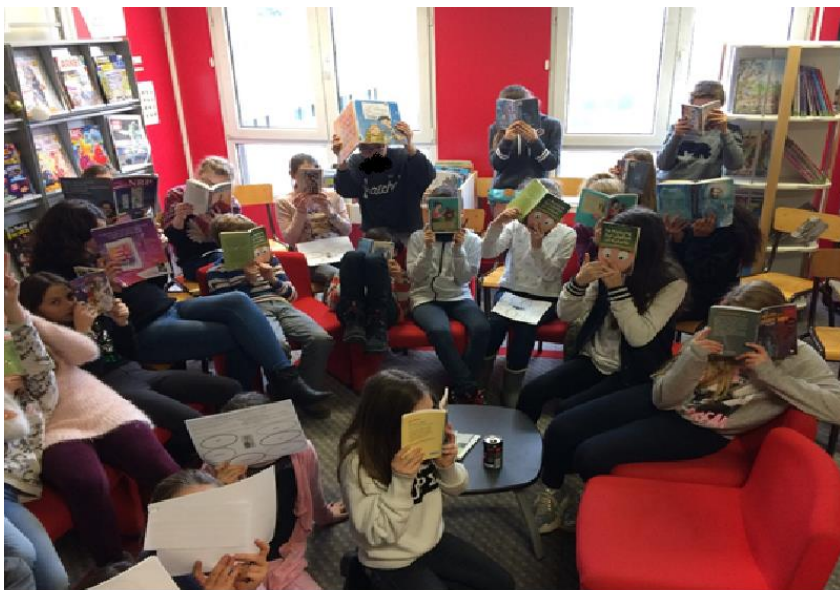
Rencontre au CDI entre élèves de 6 ème le 19 décembre dernier.

À ce projet s'ajoute pour tous les élèves du Cm2 jusqu'en BTS, une expérience de lecture à travers le « 40 Faubourg », Prix littéraire propre à Ste-Marie. Chaque élève a le loisir de participer à une aventure commune, la lecture de 5 romans sur une période définie avec à la clé une rencontre par niveau (Cm2-6 ème / 5 ème -4 ème / 3 ème -2 nde / 1 ère – Tle – BTS). Adhérer à ce projet, c'est chercher à mieux comprendre l'Humain et la société dans laquelle on vit. « Les romans enrichissent simultanément notre compétence linguistique et notre appréhension du réel » *. Dans chaque niveau, un livre sera élu et enfin pour clore l'année, chaque lecteur offrira un roman de la sélection à une association qui œuvre pour améliorer les conditions de vie des enfants hospitalisés.