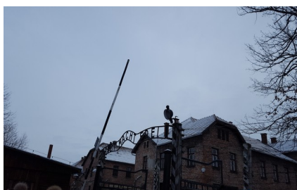
Entrée du camp d'Auschwitz

A l'entrée du camp nous apercevons un mirador, et la fameuse entrée d'Auschwitz avec l'inscription « Arbeit Macht Frei » qui signifie « Le travail rend libre ».