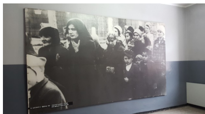
Arrivée des déportés au camp

Nous avons commencé à visiter les baraquements, ce sont les endroits où vivaient les prisonniers dans des conditions insalubres. Dans la première se trouvait une urne avec l'intérieur des cendres de prisonniers, je fus surprise et étonnée de voir qu'il restait des cendres des malheureux déportés. Ensuite nous avons vu des photos que les SS ont prise des déportés lors de leur arrivée au camp, et aussi de leurs vies sur le site. Nous avons également regardé des panneaux nous expliquant leur mode de vie, et le nombre de déportés de chaque pays à Auschwitz.