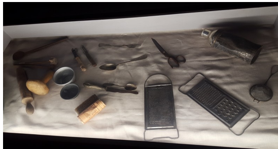
Effets des déportés

Une des deux premières pièces qui m'a le plus bouleversée et la pièce où l'on a vu les deux tonnes de cheveux qui appartenaient aux détenus avant qu'on les rase lors de leur arrivée au camp. En entrant dans cette salle, j'avais vraiment l'impression que l'atmosphère était pesante. Ensuite nous sommes passés dans des salles où étaient disposés des objets appartenant aux déportés, comme des lunettes, les valises confisquées à leur descente du train par les SS, leurs chaussures, des objets de cuisine, et leurs outils pour graisser leur chaussures. Le fait qu'ils aient pris autant d'affaires, montre que les prisonniers s'attendaient à vivre normalement et non dans l'horreur.