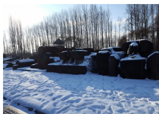
Monument à la mémoire des victimes.

Nous avons pu voir les ruines d'un crématorium, car à l'arrivée des libérateurs, les SS ont tout détruit pour ne laisser aucune trace de leurs atrocités. Nous avons également vu un monument dédié aux victimes.