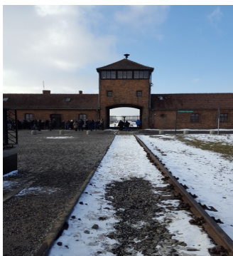
Entée de Birkenau

Ensuite vers midi nous sommes allés manger. Puis nous avons repris la visite du camp de Birkenau vers treize-heures trente, notre guide nous attendait pour continuer. A l'arrivée la première chose que nous avons vu, est l'entrée imposante du camp, où arrivait le train. C'est également à cet endroit que le « tri » des déportés s'effectuait.