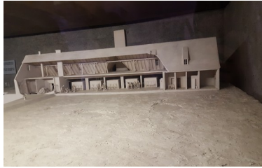
Maquette des fours crématoires