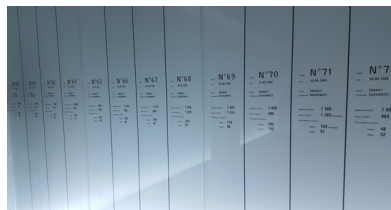
Plaques avec le numéro de convoi

J'ai été énormément touchée quand j'ai vu les photos d'enfants et des détenus. Ces dernières étaient accrochées tout le long du couloir. Puis je suis allée dans une pièce, où sur les murs étaient marqués les convois, le nombre de partants, et le nombre de survivants. Voir qu'il en restait si peu, presque pas dans certains convois m'a attristé.